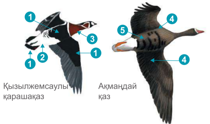
Қызылжемсаулы қарашақаз Ақмаңдай қаз

Ақмаңдай қаз ірірек, ашық бояулары аз. Кеудесі мен қанаттарының төменгі жағы сұрғылт-қоңыр (4), құрсағында үлкен әркелкі жолақтары бар (5). Жас қаздарда қара дақтары болмайды, құрсағы мен кеудесі ашық қоңыр (кейде тіпті ақ болып көрінеді).