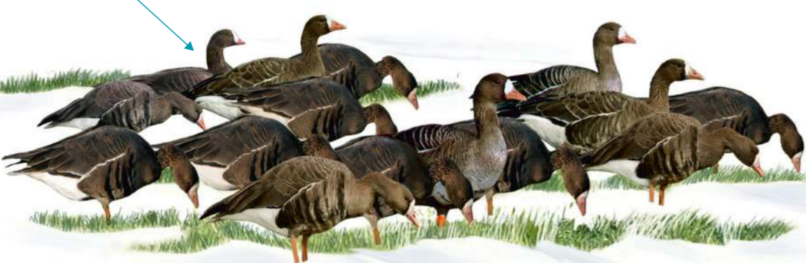
Суреттер Виктор Васильев